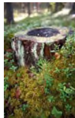
Det avverkade trädet blev cirka 130 år. Bredvid stubben växer den nya generationen skog upp, en tallplanta som är cirka två år gammal.